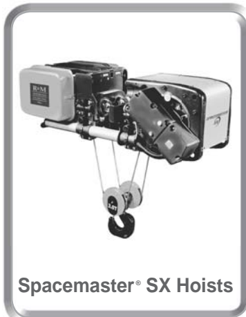
Spacemaster® SX Hoists