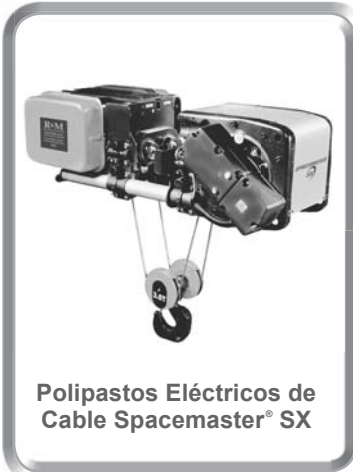
Polipastos Eléctricos de Cable Spacemaster® SX

R&M Materials Handling tiene más de 75 años de experiencia en la industria de los polipastos y puentes grúa. Nuestros productos y servicios se distribuyen a través de una amplia y variada red de empresas independientes. Esta amplia red está compuesta por ensambladores de grúas, compañías de servicio para grúas, distribuidores industriales, industrias proveedoras de equipos de entretenimiento y otros fabricantes de equipos para la manipulación de materiales.