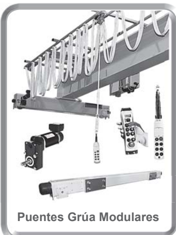
Puentes Grúa Modulares

Lo invitamos a visitar nuestro sitio web www.rmhoist.com para localizar a un Distribuidor R&M Master en su área, así como también obtener una lista completa y actualizada de contactos. También puede comunicarse directamente con nuestra planta a través de la línea telefónica, llamando al 1-937-328-5100 para solicitar información adicional.